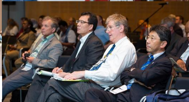
口头报告：代表们积极发言并认真倾听